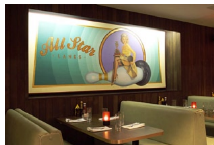
ALL STAR LANES

Stjärnjockeyn och casanovan Frankie Dettori är lika berömd för sina romanser som för sin hand med hästar. Hans otippade intresse för restaurangbranschen börjar nu ge utdelning. Frankie's Italian Bar & Grill i Knightsbridge är mycket populär bland de välbärgade Knightsbridgeborna, och nu har hans partner, superkocken Marco Pierre White, förvandlat pampiga Criterion till ytterligare ett Frankie's. Restaurangkedjan erbjuder någonting så ovanligt (för London) som vällagad mat - pizza, pasta och grillrätter med lyxtouch - till priser som även backpackers har råd med. Läget är det bästa i hela London: mitt på Piccadilly Circus.